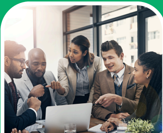
Átláthatóság és kommunikáció