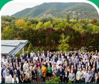
Nagyvállalatok Logisztikai Vezetőinek Klubja