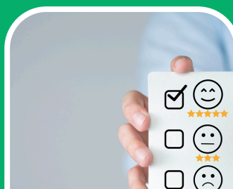
Nyomonkövetés és értékelés