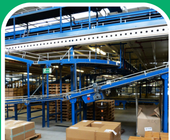
Okos logisztikai megoldások

A Ghibli Kft. számára a logisztikai optimalizáció kiemelt fontosságú terület a hatékonyság, költségcsökkentés és fenntarthatóság szempontjából. A vállalat folyamatosan törekszik arra, hogy a szállítmányozási folyamatokat optimalizálja, és az okos logisztikai megoldásokat alkalmazza a hatékonyabb működés érdekében.