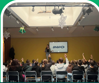
Folyamatos iskolai edukáció