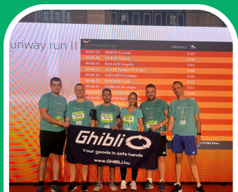
Budapest Airport Runway Run