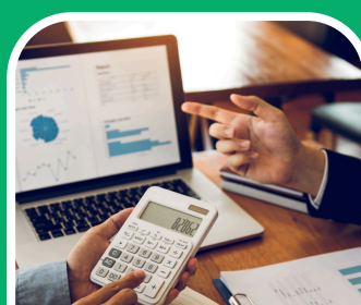
Költségcsökkentés és fenntarthatóság